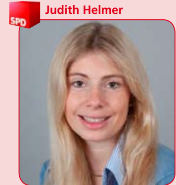
25 Jahre, Studentin ledig Peine