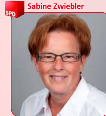
46 Jahre, Kinderpflegerin verheiratet Vöhrum-Eixe-Röhrse